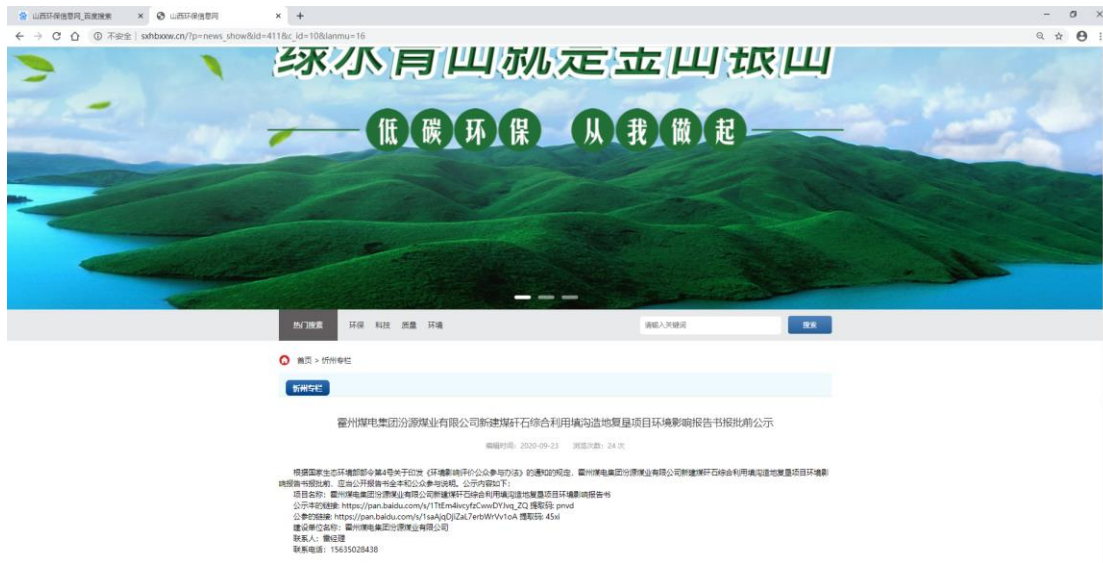
图 7 报批稿网上公示