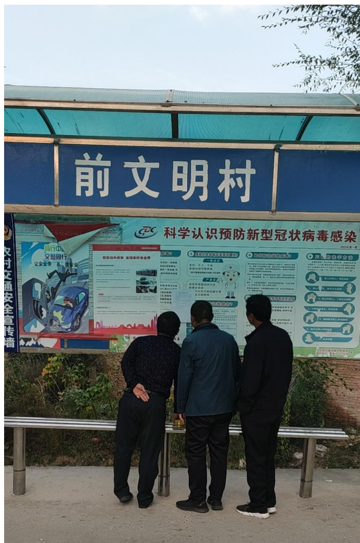
图5 张贴公告照片（前文明村）